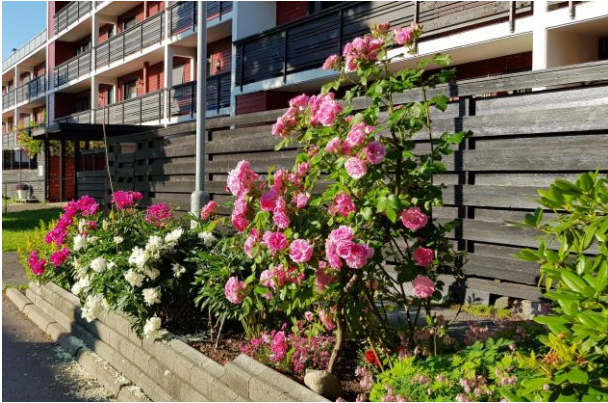
Vakre blomster utenfor Ivar Knutsons vei 54.